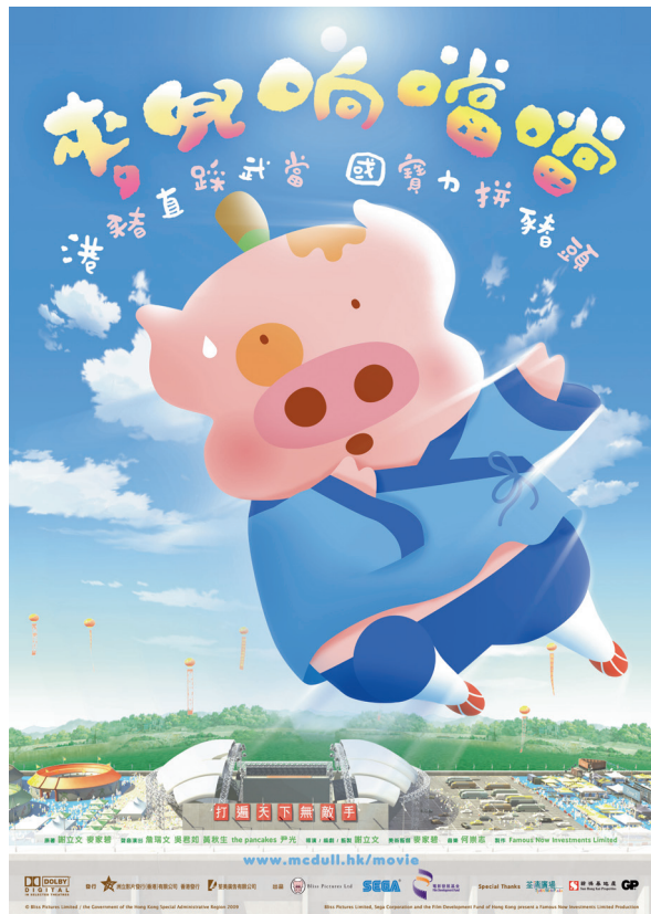
《麥兜响噏噏》 電影海報