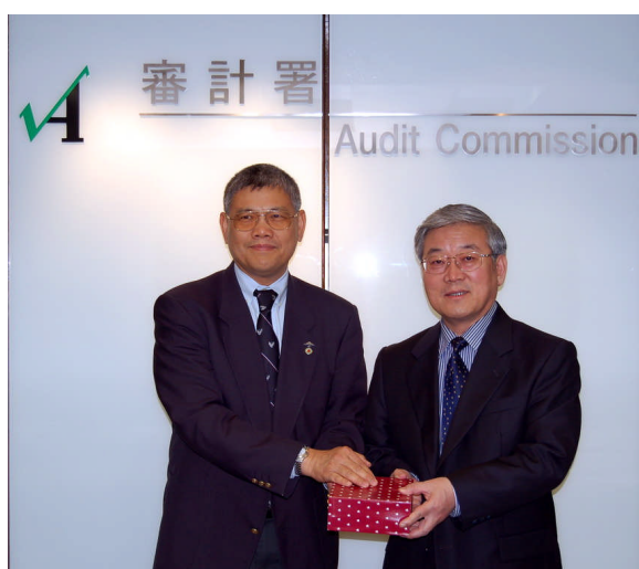
吉林省副省長矯正中先生 (右) 致送紀念品予審計署副 署長歐中民先生