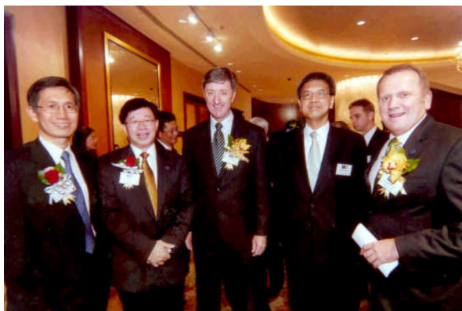
審計署署長出席澳洲會計師公會香港分會於二零零七年三月二十六日舉行的午餐會