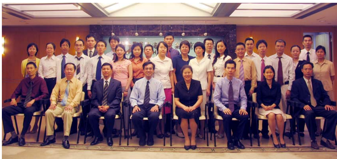
為廣東省審計廳人員舉辦的一天培訓課程