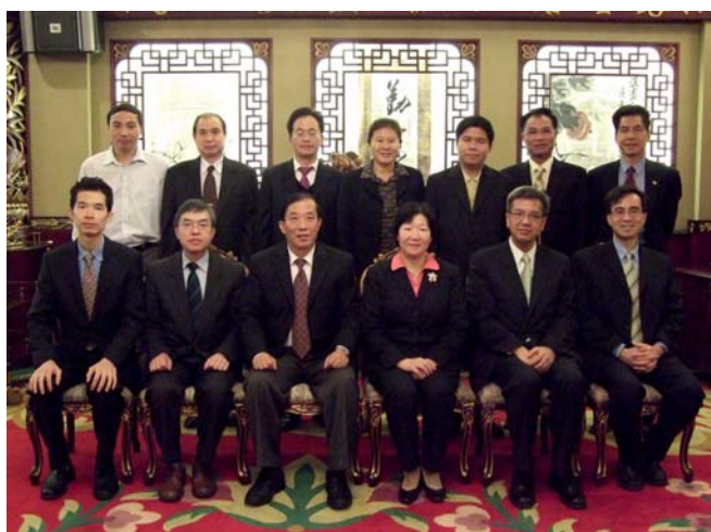
審計署代表團與中山市人民 政府市長李啓紅女士(右三) 會面