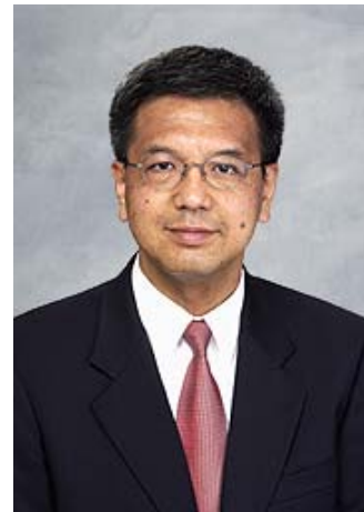
審計署署長 鄧國斌先生