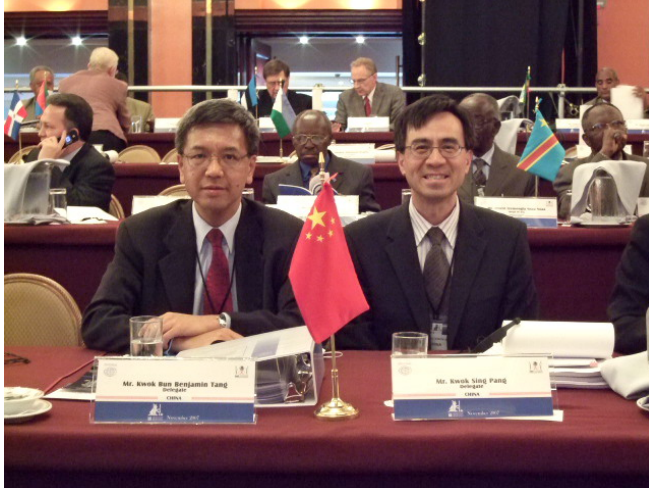
審計署署長與一名高級審計師出席最高審計機關國際組織第十九屆會議

4.19 會議討論的主題：(a) 公債的管理、問責及審計；及(b)按主要指標衡量工作表現的評核制度。會議有助本署人員掌握國際公共審計的最新發展，從中獲益良多。我們亦可藉着這個寶貴的機會，與國家審計署、澳門審計署及其他海外國家審計機關的審計人員交流意見和分享良好做法。