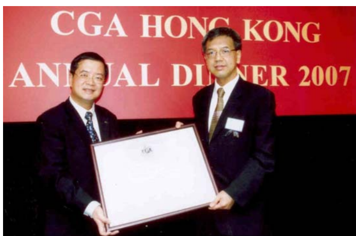
二零零七年十月八日香港加拿大註冊會計師協會周年晚宴