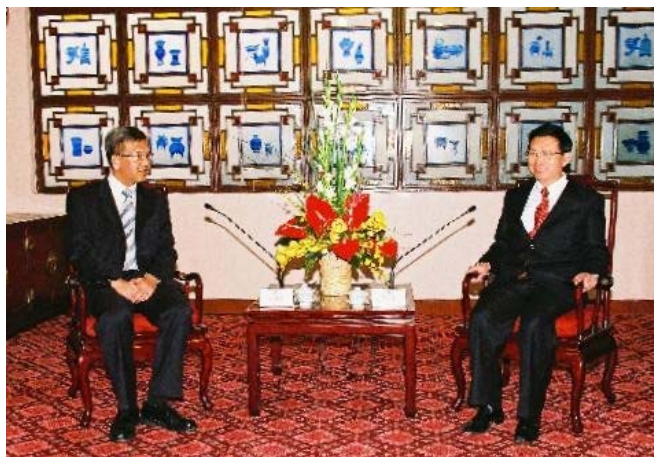
審計署署長與廣東省常務副 省長鍾陽勝先生會面