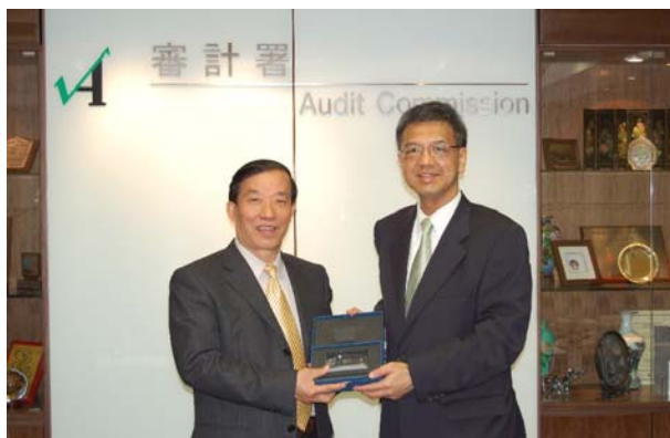
審計署署長與廣東省審計廳 廳長曾壽喜先生