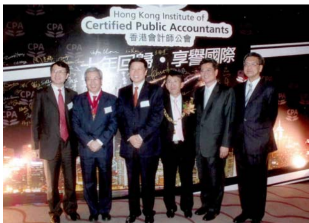
二零零七年十二月六日香港會計師公會周年晚宴