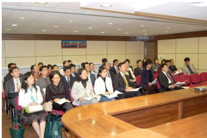
江蘇省審計廳研修班