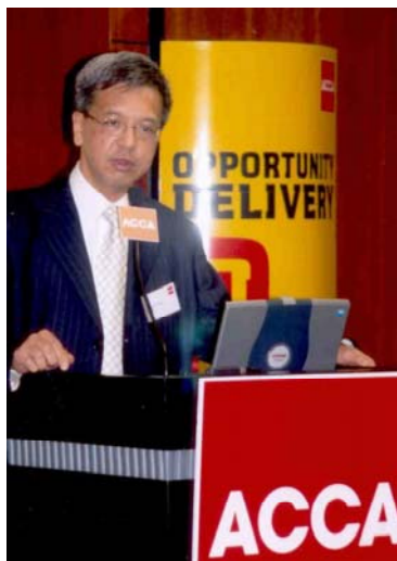
二零零七年十二月十四日向英國特許公認會計師公會香港分會會員發表演說