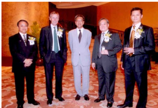
二零零七年十月四日澳洲會計師公會午餐會