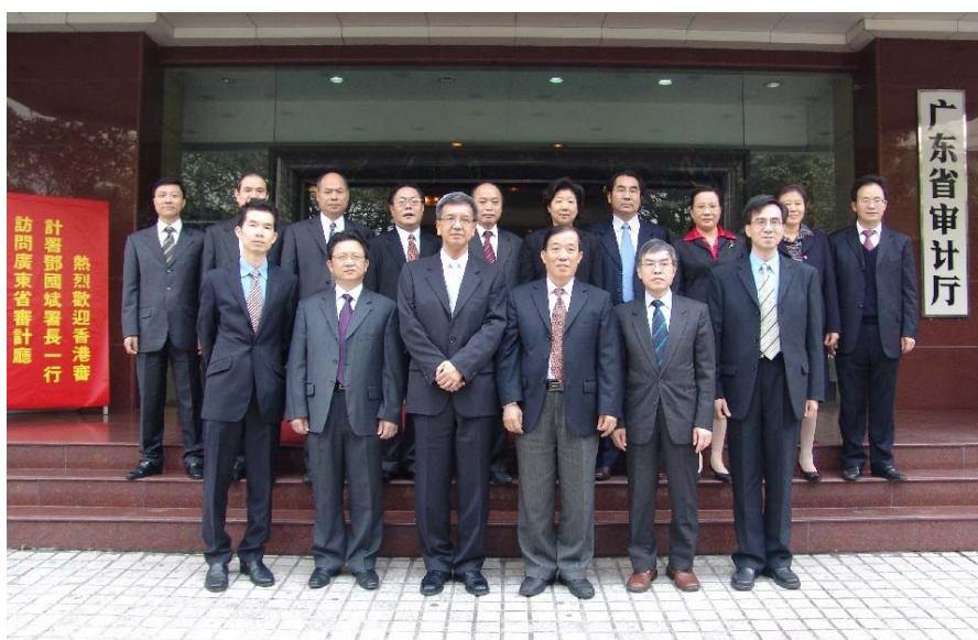
審計署代表團 與廣東省審計 廳人員會面