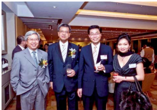
二零零八年十一月二十四日 香港加拿大註冊會計師協會 一百周年慶祝晚宴