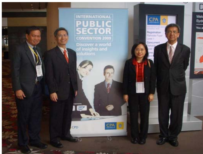
審計署署長出席二零零九年 公營機構國際會議