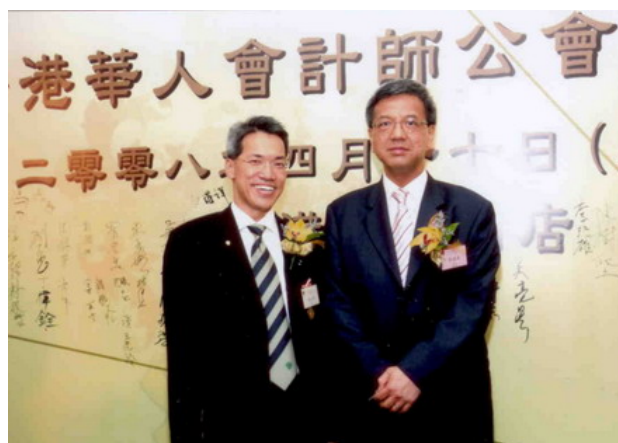
二零零八年四月十七日香港華人會計師公會九十五周年慶祝晚宴