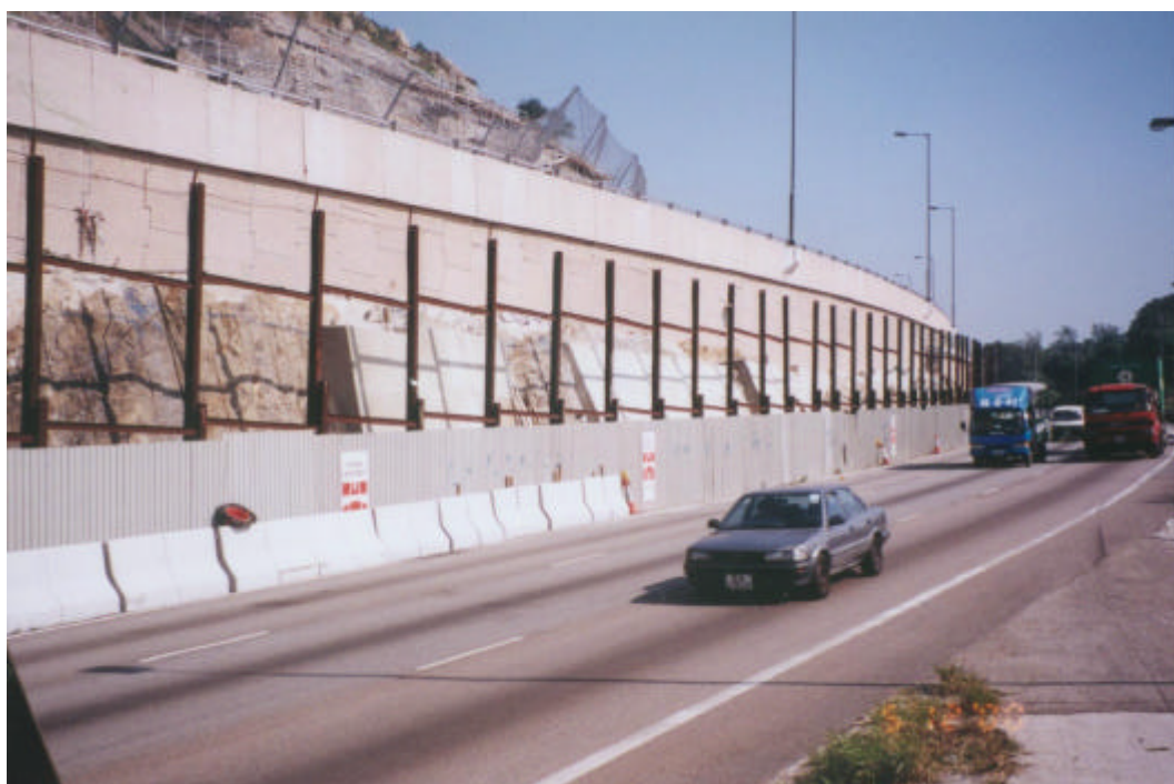
屯門公路中央分隔帶已建成的鋼筋土牆