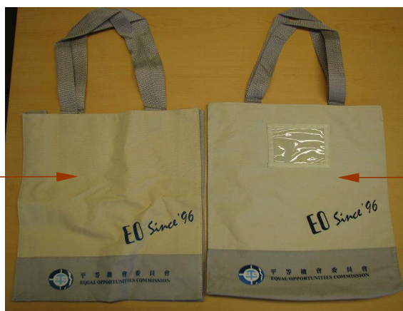
(另一面印有英文字)