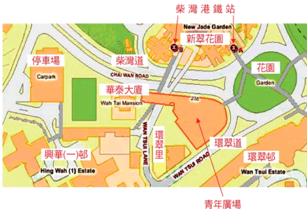
圖一 青年廣場位置