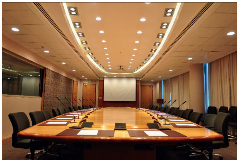
奧運大樓董事局會議廳