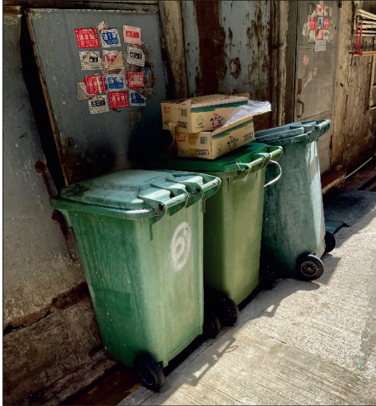
(a) 垃圾桶沒有貼上標籤