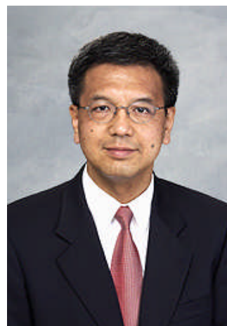
审计署署长 邓国斌先生