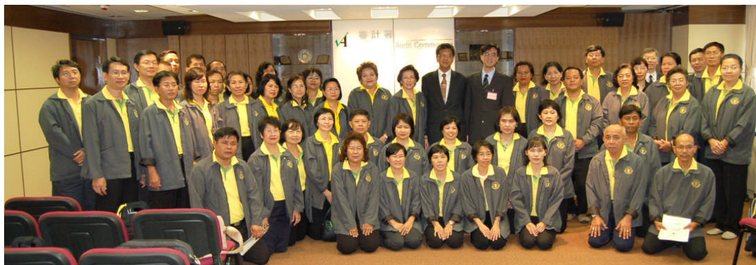
泰国审计长公署代表团