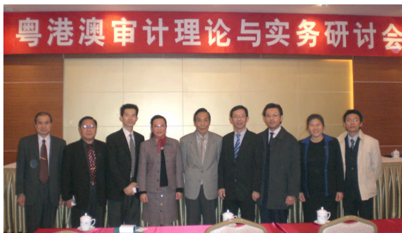
審計理論與實務研討會參加者