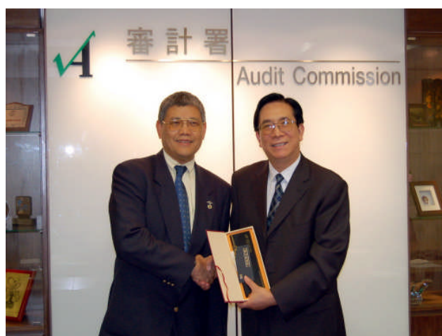
監察部副部長李玉賦先生 (右)致送紀念品予審計署 副署長歐中民先生