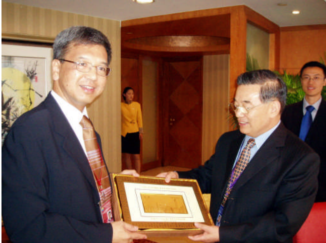
审计署署长与国家审计署 审计长李金华先生