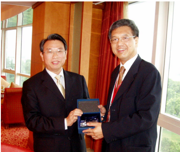
审计署署长与国家审计署 副审计长刘家义先生

4.18 参加这次大会暨研讨会会有助我们掌握公共审计的最新发展，从中获益良多。我们亦可籍这个宝贵机会，与国家审计署、澳门审计署及其它亚洲国家审计组织的审计人员交流意见和分享良好的做法。