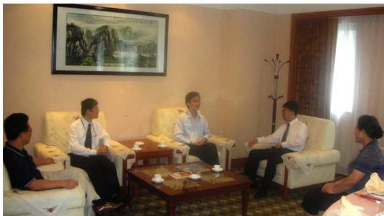
审计署人员与广东省审 计厅厅长蓝佛安先生 (中)会面

4.22 讲座开始前，广东省审计厅厅长蓝佛安先生与本署人员会面。蓝先生感谢本署两名人员前赴广州，并表示希望广东省审计厅与审计署保持紧密联系。讲座完毕，蓝先生对本署两名人员的专业精神表示赞赏，并认为讲座内容十分有用。