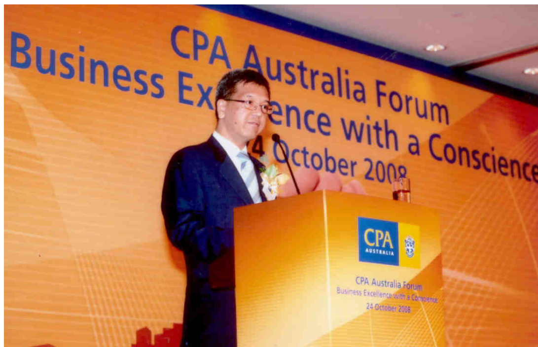
二零零八年十月二十四日 在澳洲会计师公会论坛演说