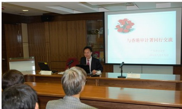
广东省审计厅主任 卢荣春先生进行简介

4.26 广东省审计厅的工作 二零零八年八月十九日，广东省审计厅主任卢荣春先生向本署人员讲解广东省的社会经济情况及审计厅的工作。出席者反应非常热烈，认为讲座内容不但有趣而且非常有用，有助他们更深入了解广东省对口机关的工作。