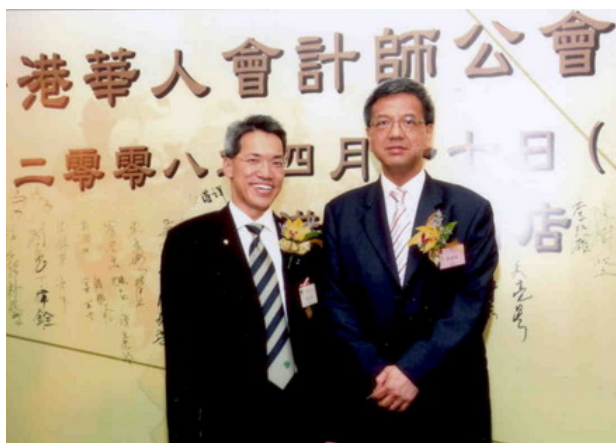
二零零八年四月十七日香港華人會計師公會九十五周年慶祝晚宴