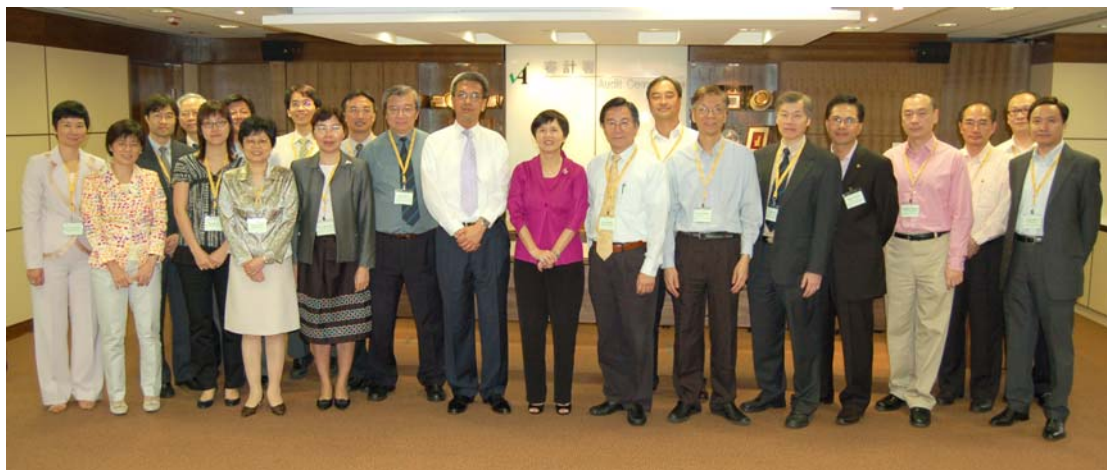
二零零八年七月十八日 公務員事務局局長訪問審計署