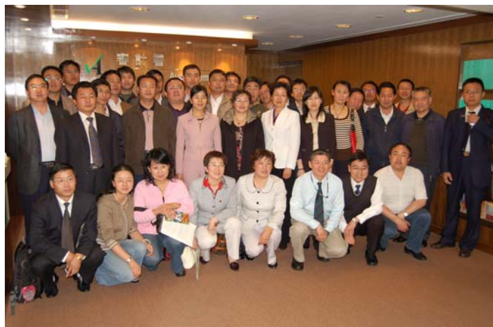
由江西省及青海省 官员组成的学习考察团