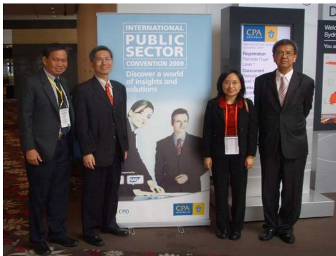
审计署署长出席二零零九年 公营机构国际会议