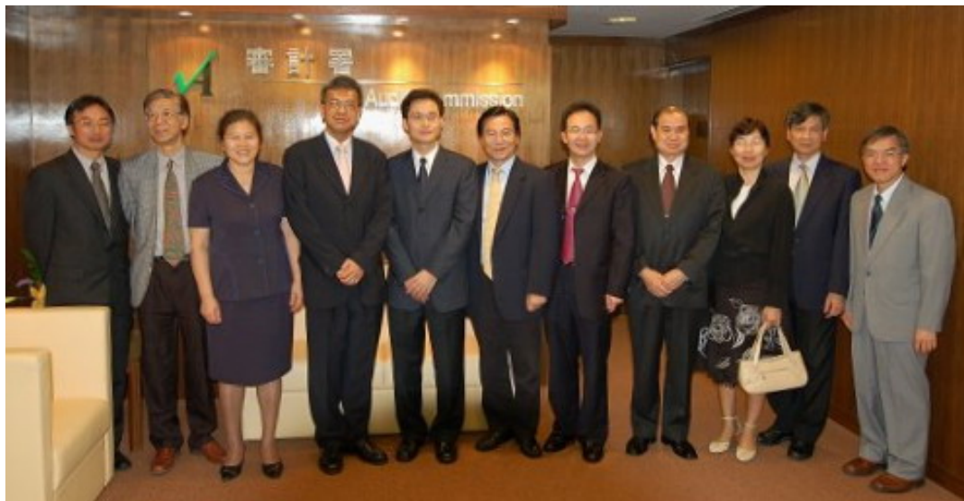
广东省审计厅代表团与 本署高级人员会面