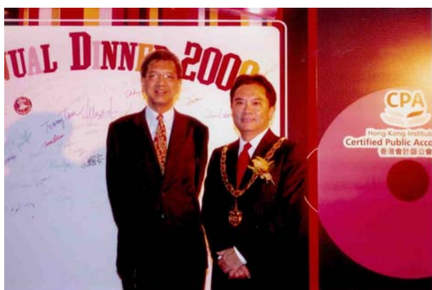
二零零八年十二月三日 香港会计师公会周年晚宴