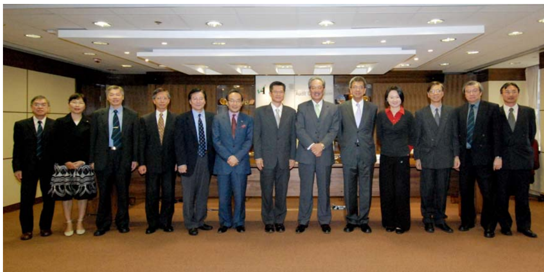
二零零八年十一月六日 政府帐目委员会委员访问审计署

4.16 二零零八年十一月六日，政府帐目委员会主席、副主席及两名委员与部分立法会秘书处职员访问审计署。审计署署长热烈欢迎各访客，并就审计署的工作进行简介。访问期间，访客与本署的高级人员就公共审计的多个范畴进行了具建设性的交流。