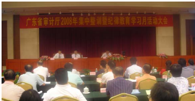
为广东省审计厅人员 举行半天讲座

通过个案研究，本署人员分享他们在衡工量值式审计工作方面的经验，并与出席者就公共审计的多个范畴进行了具建设性的交流。