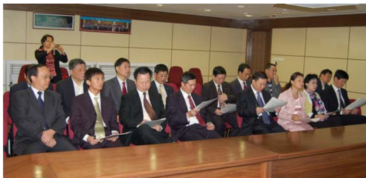
由江西省地方税务局 官员组成的学习考察团