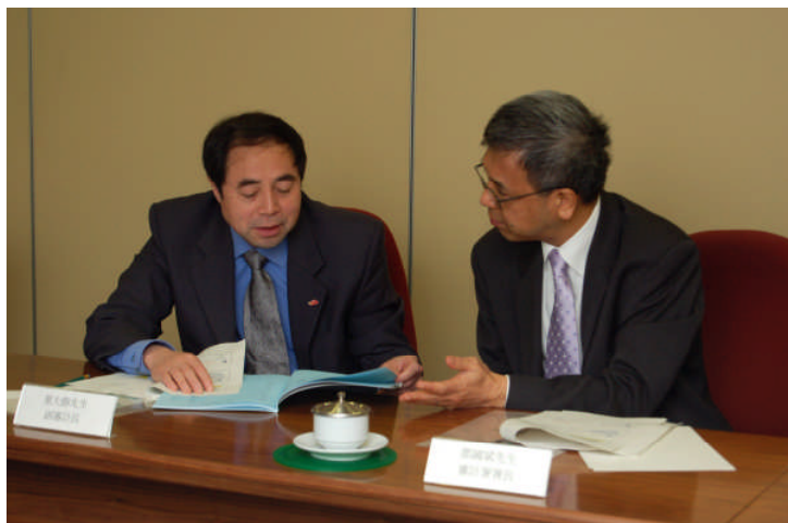
审计署署长与国家审计署 副审计长董大胜先生合照