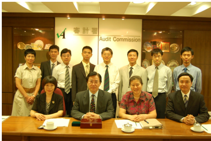
来自广东省审计厅的人员 与本署人员合照