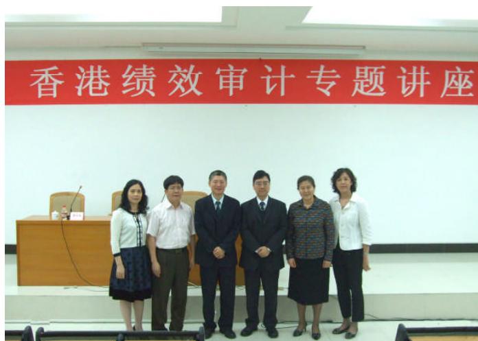
与主办机构人员合照