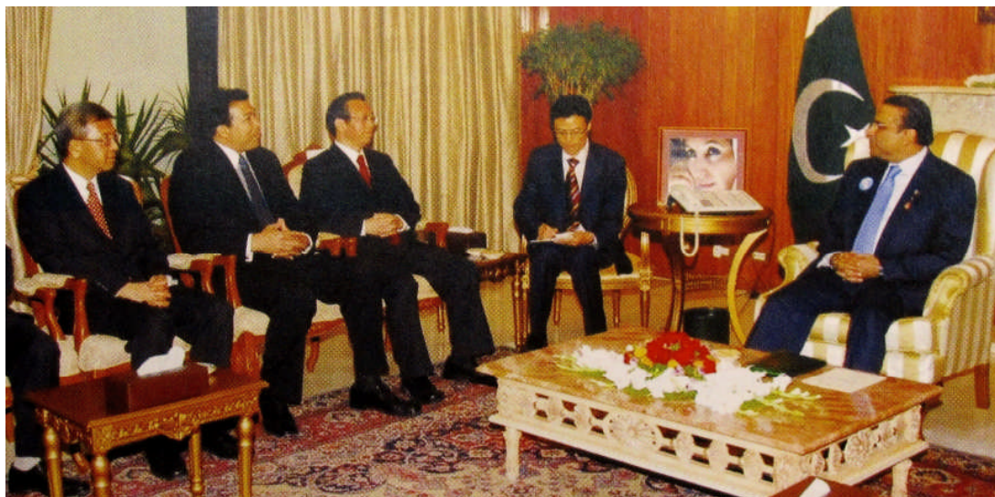
审计署署长与国家审计署审计长刘家义先生(右三)及巴基斯坦总统阿西夫·阿里·扎尔达里(右一)合照