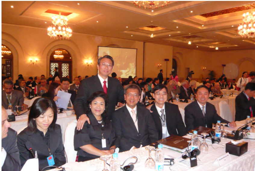
审计署署长与国家审计署审计长刘家义先生 (后排站立者)及中华人民共和国代表团其他成员合照

4.18 审计署参与上述大会及研讨会,对协助本署人员知悉公共审计的最新发展有莫大帮助。此外,亦为本署人员与国家审计署及其他亚洲国家审计机关的同业,提供宝贵机会,交流意见及分享良好做法。