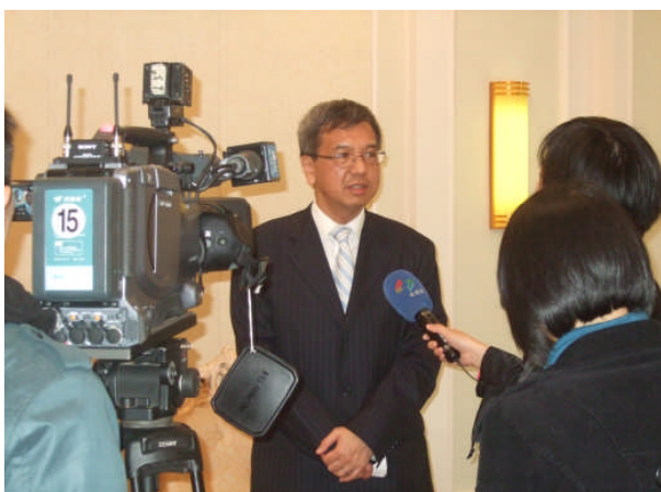
审计署署长接受佛山市顺德区一家电视台访问