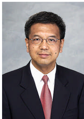
审计署署长 邓国斌先生