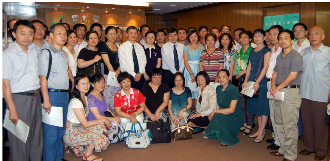
来自安徽省审计厅的学习考察团