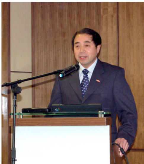
国家审计署副审计长董大胜先生向 本署人员简介国家审计署的工作