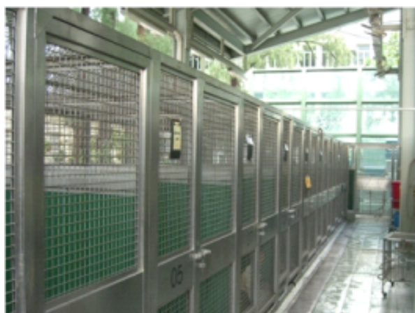
畜養流浪動物的狗房